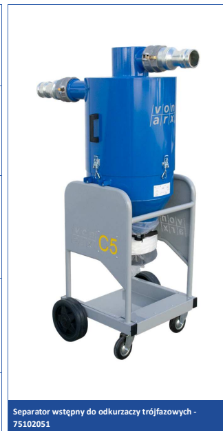
Separator wstępny do odkurzaczy trójfazowych - 75102051